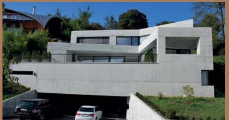
VILLA AM REBBERG IN REINACH