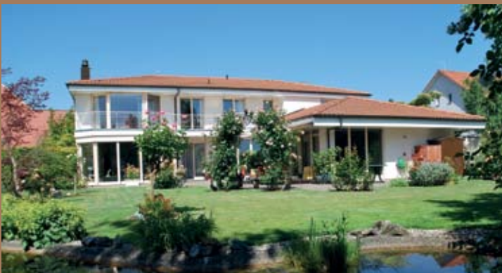
ANWESEN IN OBERWIL