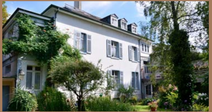
JUGENDSTIL-VILLA NAHE DER BASLER ALTSTADT