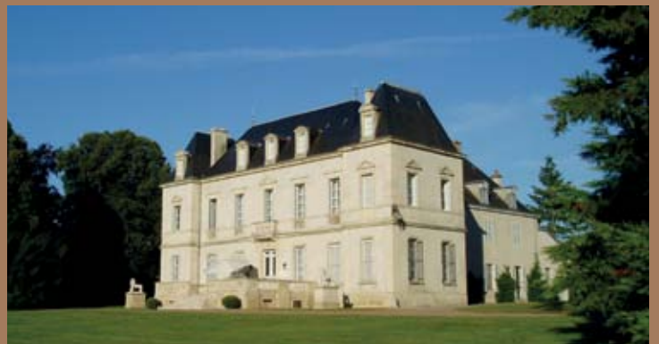
SOMMERSITZ IN FRANKREICH