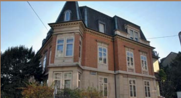
RENOVATIONSBEDÜRFTIGES HERRENHAUS IN BASEL