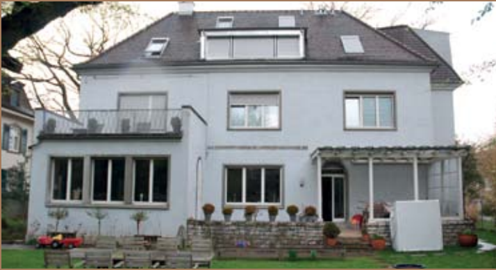
12 Zi- STADTVILLA IM GELLERT