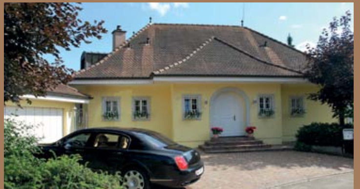
LANDHAUS-VILLA IN MÖHLIN