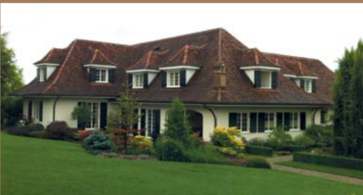
EXKLUSIVES LANDHAUS MIT 1000 m 2 WOHNFLÄCHE IN BINNINGEN