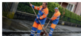
Aktuell Drägg ewägg... 7