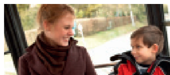
Jugend Komplizen gesucht 16