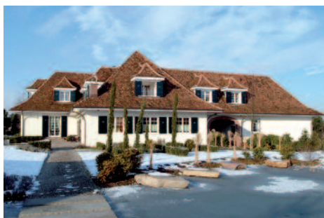
Luxusvilla in Binningen