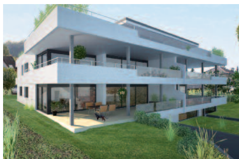
Aktuell: Neubauwohnungen in Pfeffingen

Der Immobilienmarkt im Raum Basel ist fantastisch. Die Immoline-Basel AG wächst und entwickelt sich kontinuierlich. Aus diesem Grund haben wir uns als Basels führendes Immobilienunternehmen entschieden, mit unserem Kundencenter auch im Herzen von Basel für unsere Kunden präsent zu sein. ■